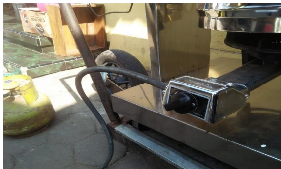
Gambar 5. Pengenalan Bagian-Bagian Alat Pengaduk Jenang.

Pengenalan bagian-bagian alat pengaduk jenang diawali dengan penjelasan utama fungsi dan manfaat alat. Kemudian dilanjutkan mengenalkan bagian-bagian dari alat. Pengenalan bagian-bagian alat digambarkan pada gambar 5. Pengenalan Bagian-Bagian dari mesin pengaduk jenang.