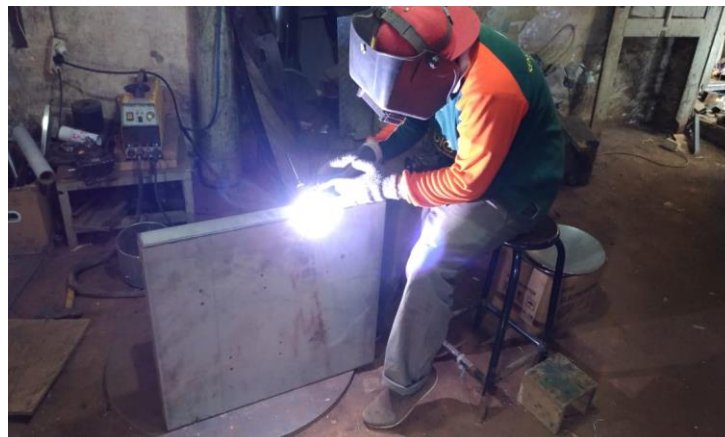
Gambar 3. Proses Pengelasan /Pembuatan Alas Mesin.

Alas mesin dibuat menggunakan bahan stainless dengan ketebalan 0,7 mm dikarenakan agar mesin memiliki kekuatan lebih pada saat melakukan proses produksi jenang. Ukuran alas adalah 40 cm x 80 cm. Proses pemotongan dan pengelasan terlihat pada gambar di bawah ini.