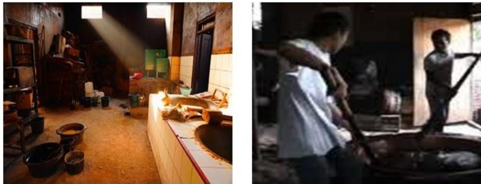
Gambar 1. Tempat Produksi dan Pengolahan Jenang Dua Keris dan Sinar Fadhil

Kekurangan lain pada ke-dua mitra adalah pada sistem pemasaran. Sistem pemasaran yang digunakan adalah dari mulut ke mulut. Belum terdapat satu sistem pemasaran multi way yaitu baik dengan promosi media cetak maupun iklan. Sistem pengemasan dan pelabelan juga masih menggunakan teknik manual yaitu dengan lilin plastik. Diharapkan dengan program PKM akan dapat meningkatkan kualitas dan kuantitas serta dayaguna promosi sebagai strategi pemasaran produk. Permasalahan yang menjadi prioritas utama ke-dua mitra dan disepakati untuk diselesaikan selama pelaksanaan program PKM.