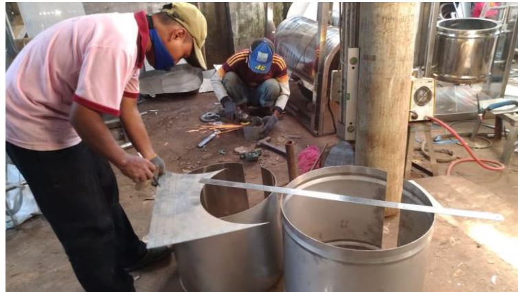
Gambar 2. Proses Pengukuran dan Pemotongan Bahan

penghalusan memakan waktu 6 jam dengan menggunakan alat pemotong khusus seperti pada Gambar 2. di bawah.